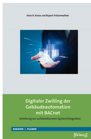
Buch zum Digitalen Zwilling