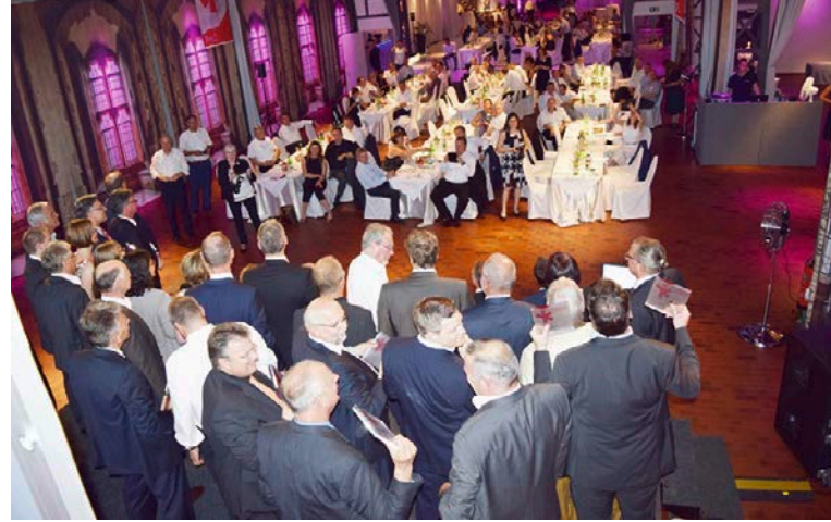
Rückblick: 200 Gäste waren beim Vertrauenspreis 2017 dabei – wir hätten sie auch dieses Jahr gerne so zahlreich in Karlsruhe begrüßt. Hier stehen die damaligen Gewinner im Blitzlichtgewitter. Gefeierte wurde im Anschluss bis tief in die Nacht.