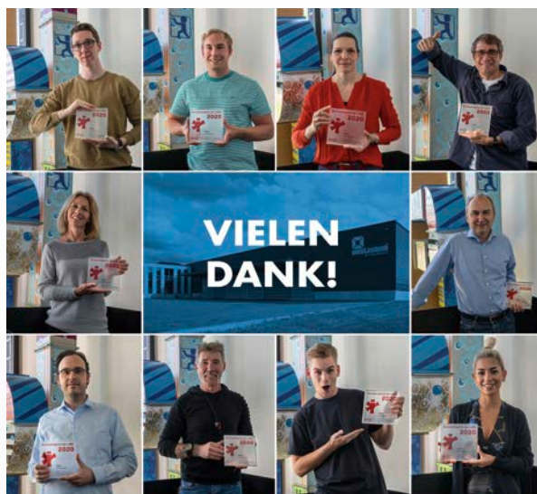
Das Team der MEZ-Technik bedankt sich für die Auszeichnung