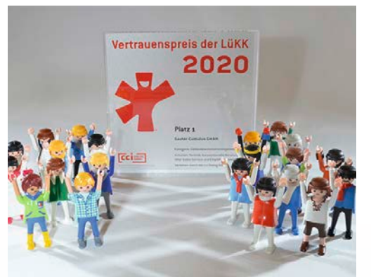
Das „Sauter-Team“ freut sich über den Vertrauenspreis.

Viele der ausgezeichneten Unternehmen zeigten auf ihren Webseiten, dass Sie den Vertrauenspreis 2020 gewonnen haben und bedankten sich bei ihren Kunden. Hier zwei Beispiele.