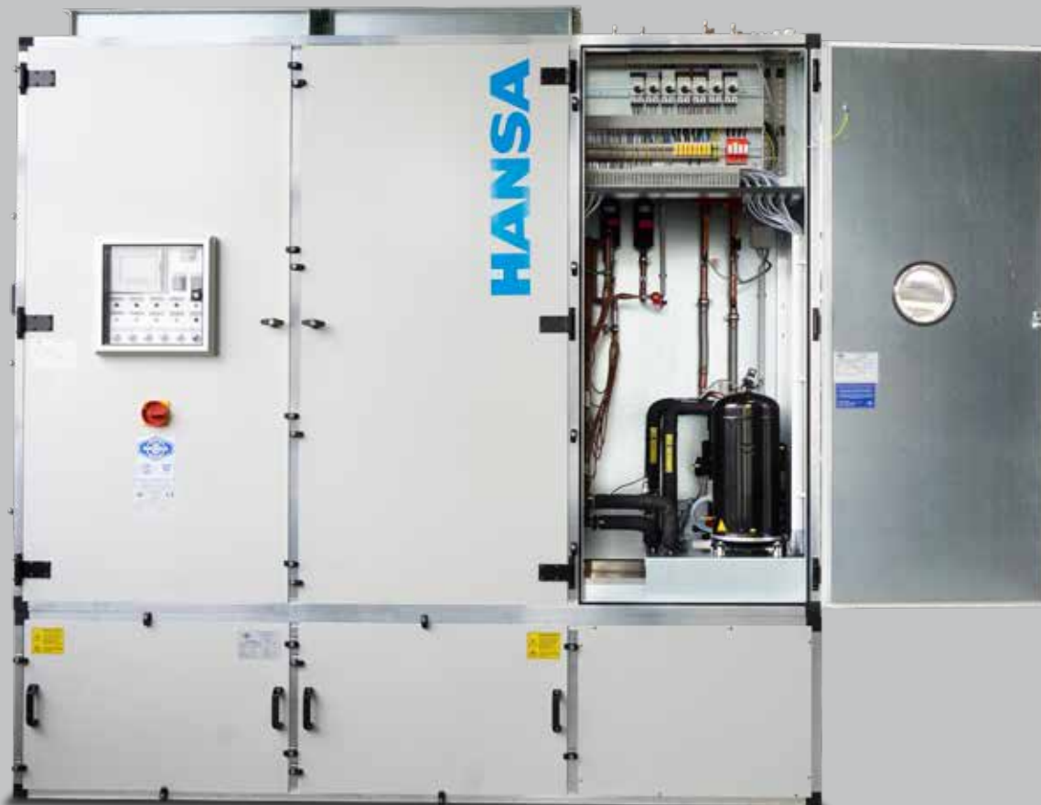
ReCool Line 18-iK mit integrierter mechanischer Kälte