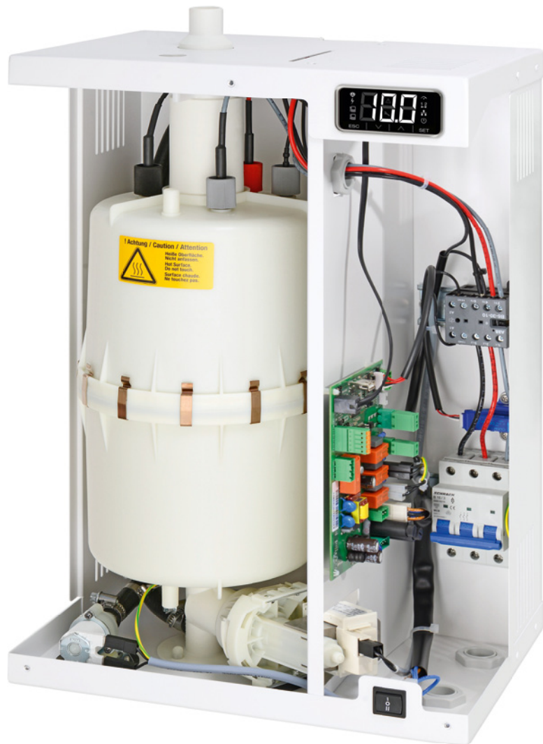
Abbildung StandardLine Elektrode