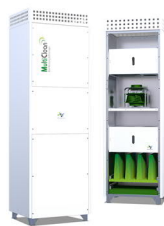
MultiClean L - „traffic white“