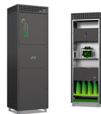
MultiClean L - „anthracite“