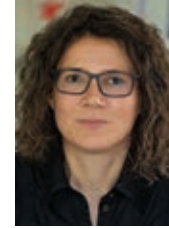
Marion Burst Anzeigendisposition

Fon +49(0)721/565 14-23 Fax +49(0)721/565 14-50 medienberatung@cci-dialog.de